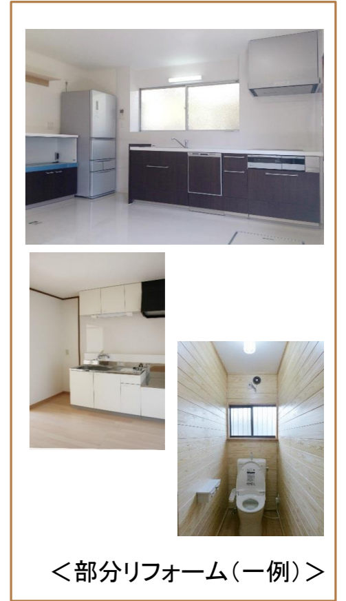
<部分リフォーム(一例)>