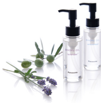
【美泡湯オイル】 (オリーブとラベンダーはイメージ)