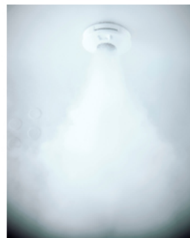
【オイルヴェール酸素美泡湯 イメージ】