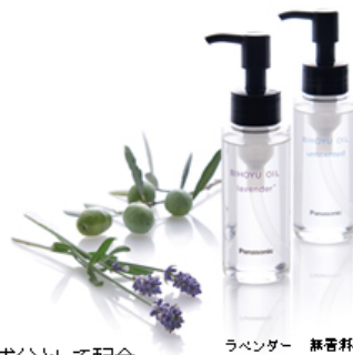
ラベンダー 無香料