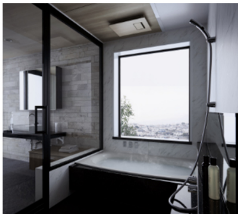
【オイルヴェール酸素美泡湯 設置イメージ】