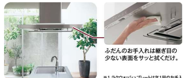
ふだんのお手入れは継ぎ目の 少ない表面をサッと拭くだけ。

レンジフードの下でも会話をさまたげない静けさです。 また、ファンのお手入れは10年間不要。