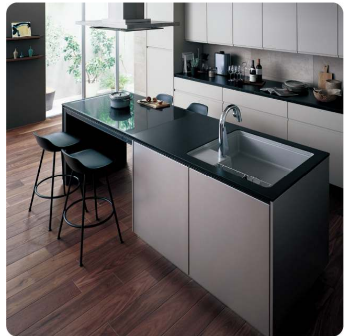
コンロの下がオープンなので椅子を置いても邪魔になりません。

4つのコンロで同時に 調理ができるので、 煮たり焼いたり、 レパートリーが 広がります。