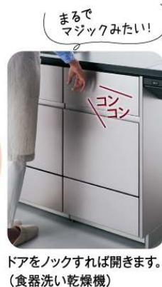
ドアをロックすれば開きます。 (食器洗い乾燥機)